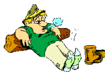
mach mal Pause

Massenbewegung geworden ist: Immer Entspannung und Abwechslung vom Alltagssorgen für ein paar Stunden Menschen ein Grundbedürfnis in der alles, was das Leben schöner macht.