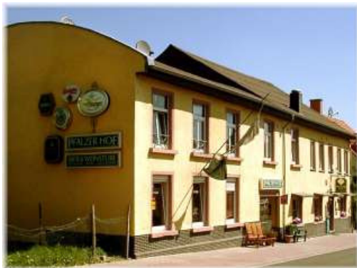
Gasthaus Pfälzer Hof

E-Mail: Mail@Pfaelzer-Hof-Partenheim.de * Internet: www.pfaelzer-hof-partenheim.de