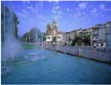
Avenida Central - Braga

Zusammen mit Porto befinden sich in Braga die meisten Barockbauten Portugals. Die spätbarocken Gebäude entstanden unter dem Erzbischof Dom Jose de Braganca. Aber nicht nur die Kirchenbauten werden vom barocken Stil beherrscht, auch weltliche Gebäude sind im diesem Stil erbaut worden.