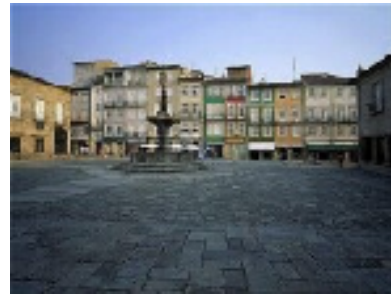
Largo do Paço - Braga

Am Ende eines öffentlichen Parks mit Brunnen und Spielplätzen liegt der von Arkaden gesäumte Platz der Republik (Praça de Republica). Hier werden Waren wie Holzschuhe und Holzspielzeug aus dem Minho feil geboten.